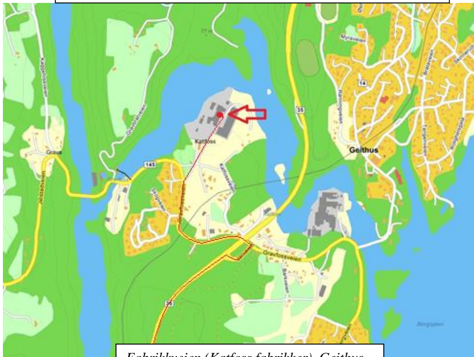
Fabrikkveien (Katfoss fabrikk), Gethus

Gå inn på modumbtk.no for link til hallen i google maps («kjør veien virtuel»)»