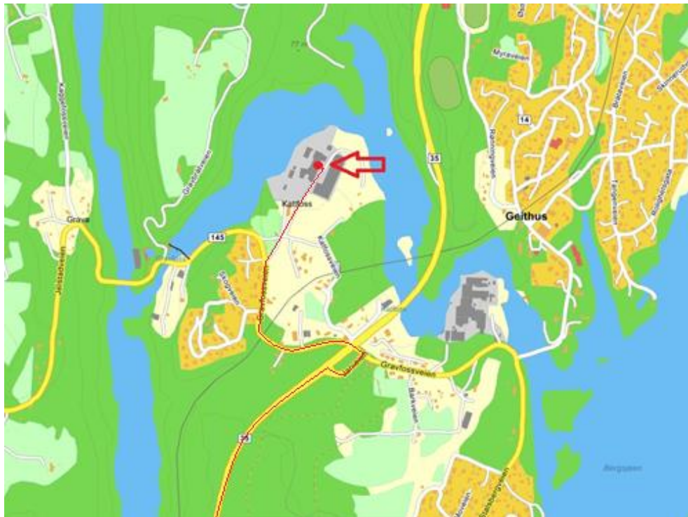
Fabrikkveien (Katfoss fabrikk), Geithus

Inngangen er merket med rødt på bildet til høyre